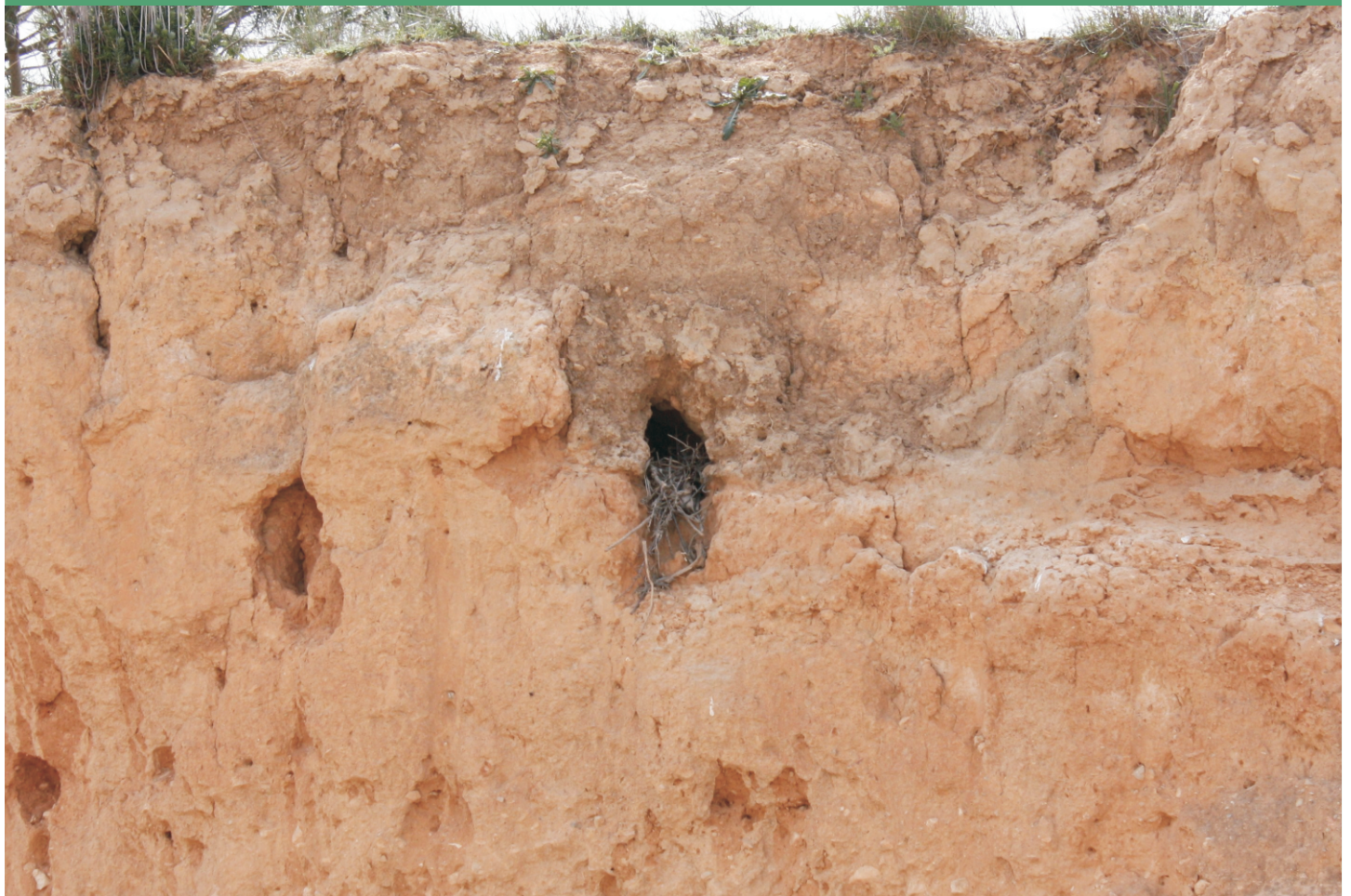
Nido de gajilla en talud de rambla