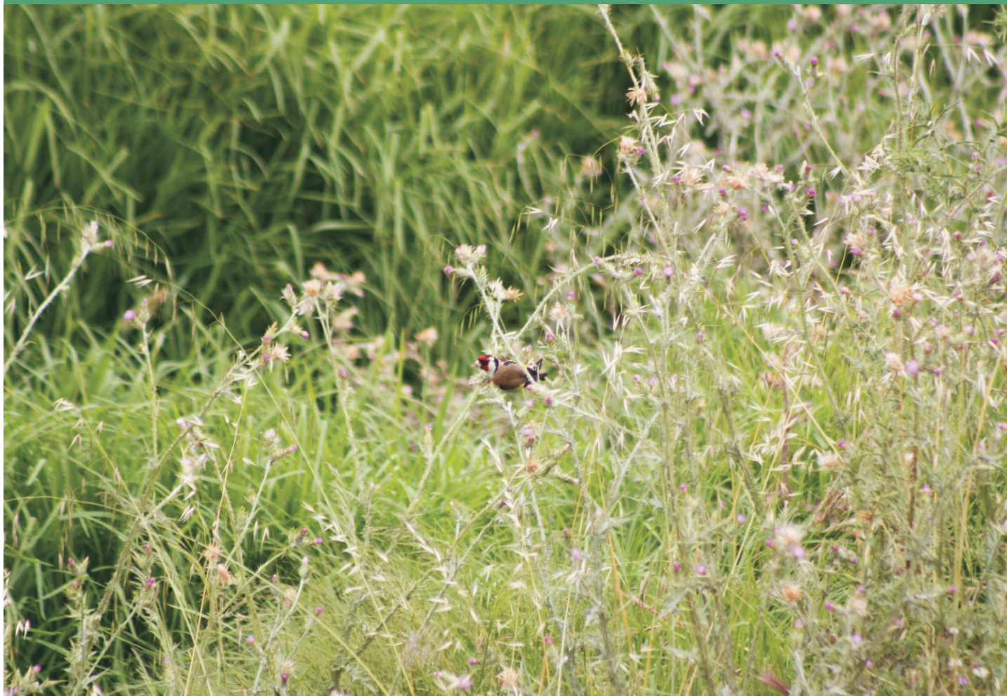
Jigüero alimentándose en herbazal de gramíneas y compuestas