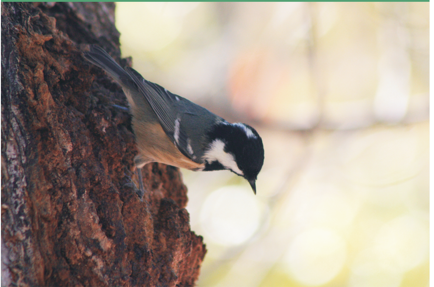
Carbonero garrapinos buscando insectos. Se aprecia la banda de la nuca y las dos franjas del ala