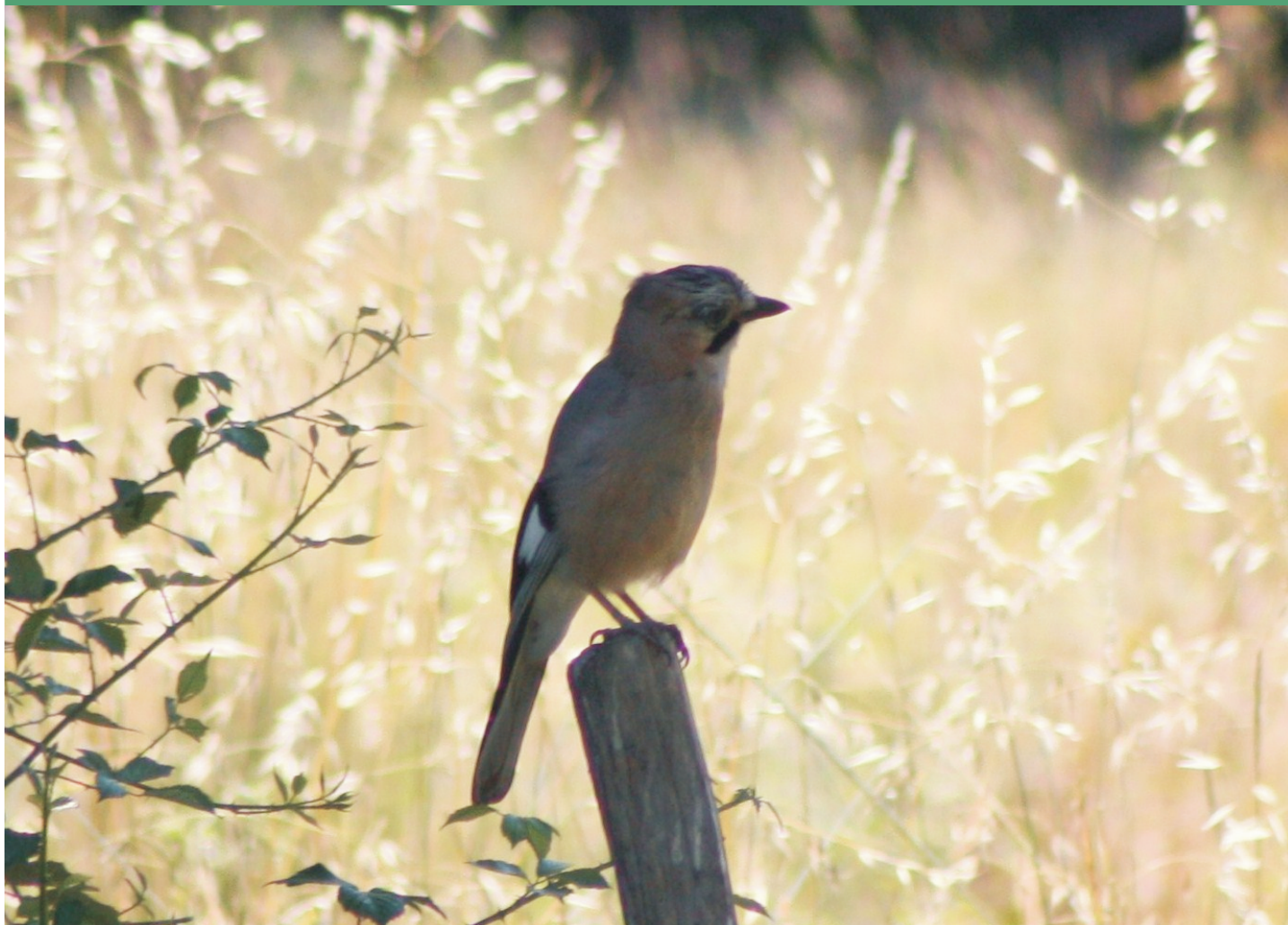
Arrendajo con la característica bigotera y estrias sobre la cabeza